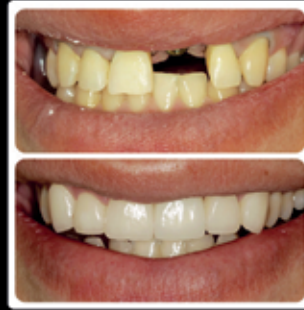
MAKEOVER REAL CON CARILLAS E IMPLANTE

ODONTOLOGÍA DE PRECISIÓN Y ALTA ESTÉTICA IMPLANTES • ENDODONCIA • ORTODONCIA