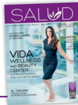
PORTADA VIDA WELLNESS and Beauty Center

REPRESENTACIÓN EN SAN DIEGO Energy Communications [619] 585.93.98 y [619] 585.94.63 637 3rd. Avenue Suite B Chula Vista, California 91910 salesusa@revistamujeractual.com