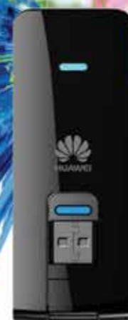
HUAWEI E397 BU-501 LTE

Detalle de cobertura 4GLTE en www.telcel.com/4glte Para más detalles sobre estos beneficios visita tu Punto de Venta o Centro de Atención a Clientes Telcel más cercano, o llama al 01800 0262 626