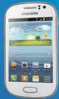
SAMSUNG FAME GT-S6810M