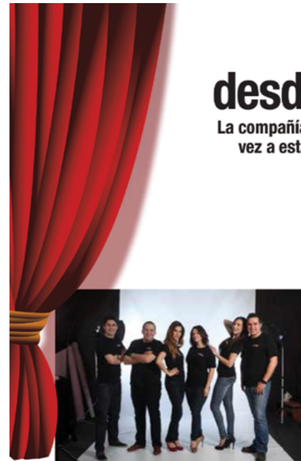
Una compañía joven y entusiasta