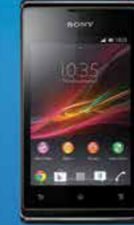
SONY XPERIA E C1504