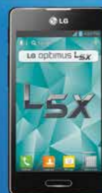
LG E450 OPTIMUS L5X

Plan telcel Frontera 300 por $437.87 renta mensual